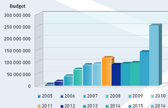
Ett exempel på gränskostnader: budget för EU:s gränsbyrå

smugglarverksamhet. Dessa effekter har i sin tur lett till en förstärkning av gränssäkerhetsmodellen och utvecklandet av en hel gränsindustri, vilket rapporten ingående analyserar. Gränsbyråer, polismyndigheter, militärer, försvarskoncerner och regimer i icke-europeiska länder har stegvis stärkt sina positioner och resurser inom kampen mot migrationen, och har i samarbete med politiker skapat flera säkerhetsinitiativ efter varje ny gränskris i södra Europa. Gränskontrollernas misslyckande har med andra ord lett till en större marknad för fler nya kontroller.